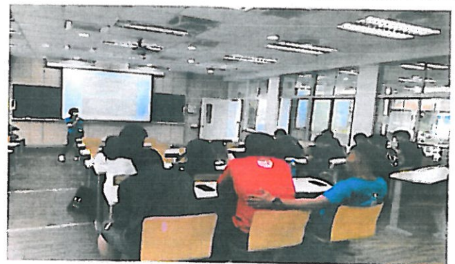
講師於課程向學生介紹香菸的成分及對於草的認識。