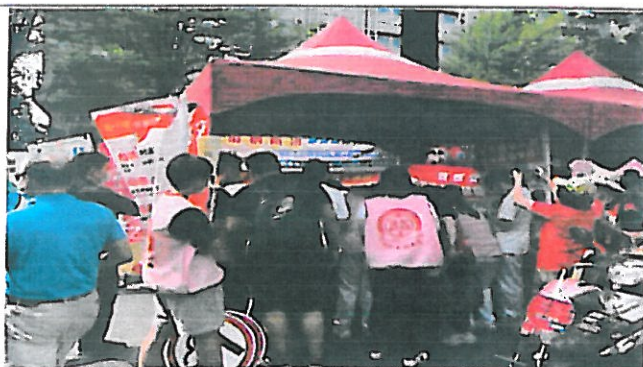
學生熱烈參加菸害防制宣導活動，一起向菸害說“不”。