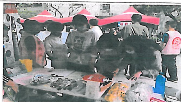
護理師向全校師生宣導電子菸對身體的危害有獎徵答的活動。