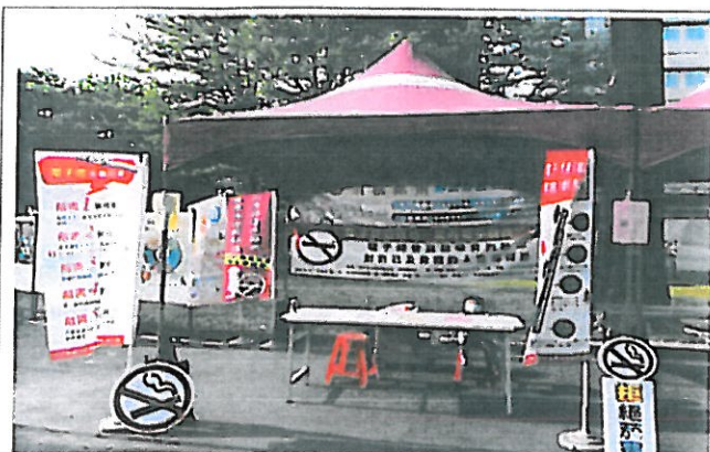
於55週年慶，攤位前佈置，宣告電子菸恐致命，加強全體師生對電子菸的認知。