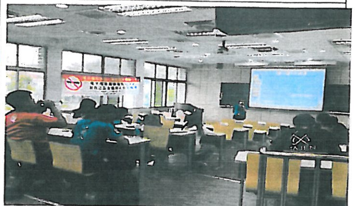
講師介紹電子菸對身體的五大危害並告知抽電子等同香菸。