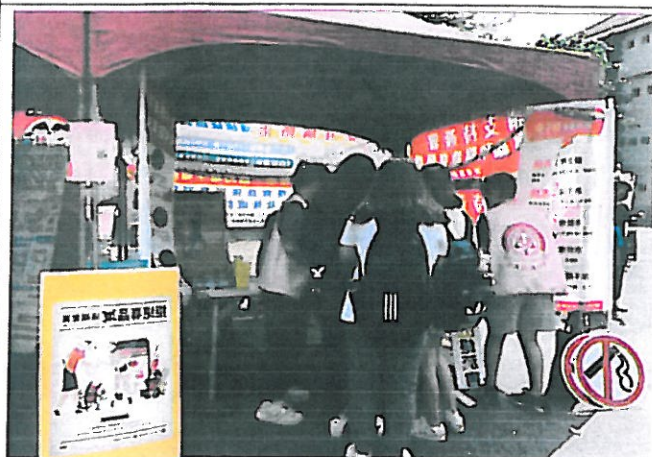
藉由擺攤宣導菸害防制的重要性及菸害正確觀念的認知