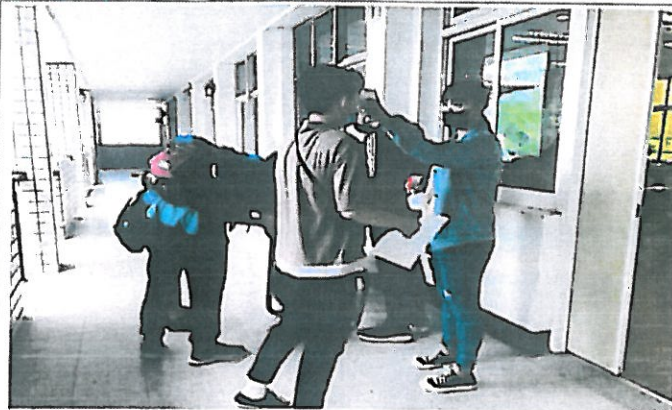
參加菸害防治講座的學生入大講堂前做防疫措施-測量體溫及用酒精消毒手部並全面配戴口罩入講堂。