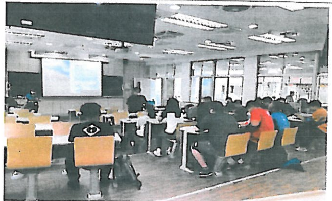
衛保組組長向學生介紹講師經歷及告知學生吸菸對身體的危害。