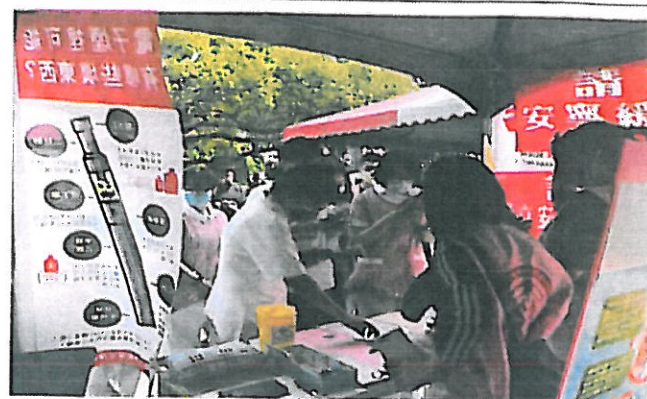
護理系老師帶學生幫忙宣導無菸害校園，掃菸害防制問卷Q-RCode送贈品。