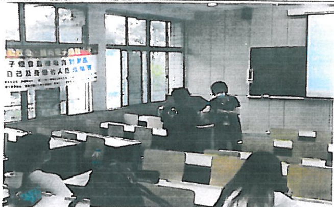
講師於課堂上跟學生互動，有獎徵答，答對問題即送精美贈品一份。