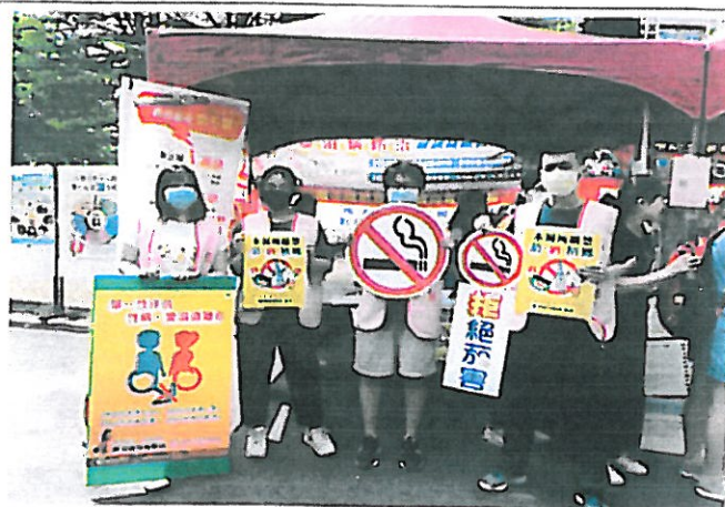
衛保組的工讀生協助幫忙宣導菸害對身體的危害，拒絕菸害的標語。